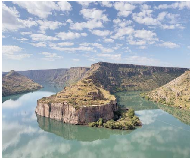
Ruinen von Rumkale auf einem Umlaufberg in einer Flußschleife des Euphrat

Nach der Anmeldung zu dieser Reise wird mit der von GEOPULS zugesandten Buchungsbestätigung eine Anzahlung (15% des Reisepreises) fällig. Die Restzahlung erfolgt 2 Wochen vor Reisebeginn. Es gelten die Geschäftsbedingungen der Geopuls GbR, Neckarhalde 62, 72108 Rottenburg (Tel. 07472-9808802). Bitte beachten Sie vor Reisebuchung unsere Allgemeinen Reisebedingungen sowie das Formblatt zur Unterrichtung des Reisenden bei einer Pauschalreise nach § 651a des BGB (EU-Richtlinie 2015/2302). Beides schicken wir gerne vor Buchung zu oder kann auf/von der Geopuls-Homepage eingesehen/ausgedruckt werden. www.geopuls.de